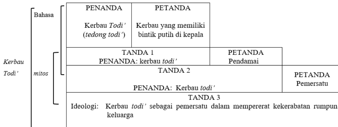
Gambar 4: Penanda Kerbau Todi'

mitos, menghasilkan petanda baru yakni sebagai pemersatu. Dalam konteks ini, kerbau todi sebagai pemersatu yang akan mempererat tali kekerabatan rumpun keluarga sehingga selalu hidup tentram dan damai.