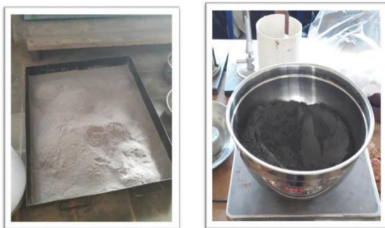
Abu Sekam Padi Abu Batubara Gambar 1. Abu Sekam & Abu Batubara

diantaranya pada lamanya waktu ikatan awal adukan mortar, kekuatannya, serta kekedapan airnya setelah mortar mengeras.