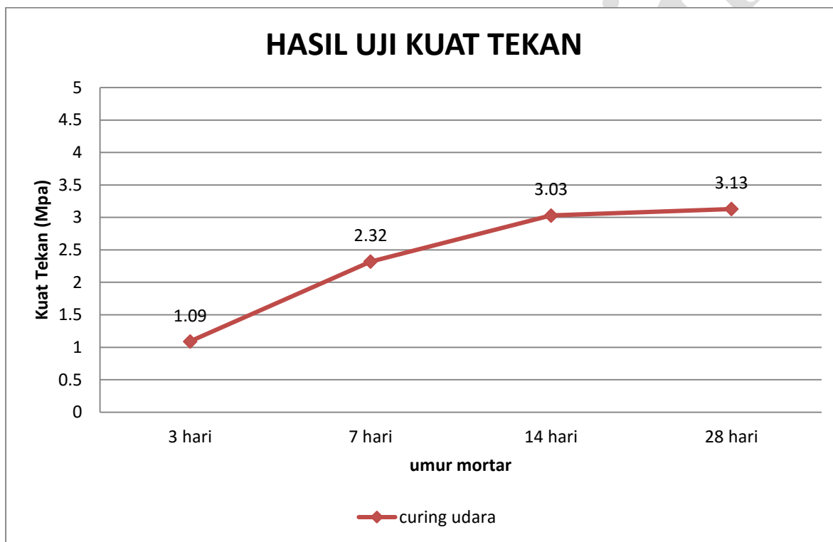
Grafik 2. Kuat tekan mortar geopolimer 15 molar perawatan kondisi kering