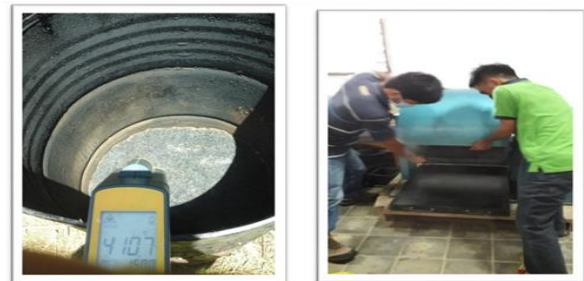
Gambar 2. Proses Pembakaran & penghalusan Abu sekam Padi

Metode pengujian dan peralatan yang digunakan dalam pengujian sesuai SNI atau sesuai persyaratan lainnya dalam metode uji.